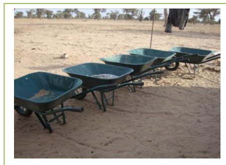
Fotos siembra, aperos, producción y técnicos de la cooperativa agrícola