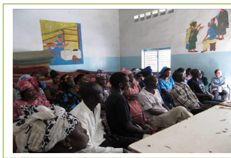
Fotos talleres capacitación en Senegal

Resultado 3: Creadas dos nuevas oportunidades de actividades productivas y nuevas iniciativas empresariales orientadas a la economía solidaria.