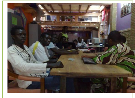
Fotos talleres en Valencia

Resultado 2: Formados y formadas los y las jóvenes de Fass y Bambey que se encuentran en situación de exclusión social en comercio, en gestión administrativa, cooperativismo, medio ambiente, género y desarrollo.