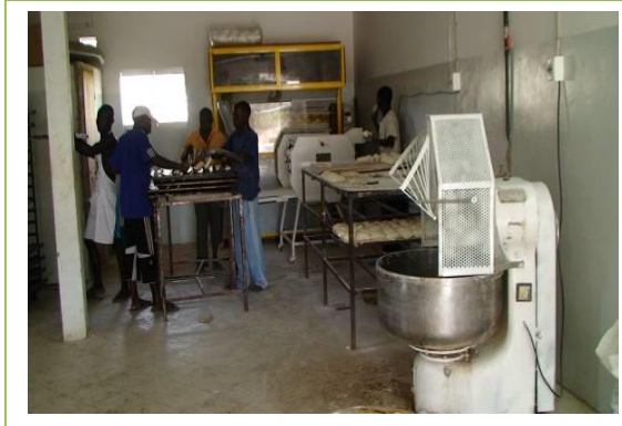
Fotografías cooperativa de pan en producción