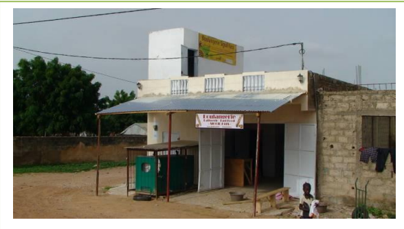
Puesto de venta de pan de la cooperativa con cartel nombre del proyecto y financiador